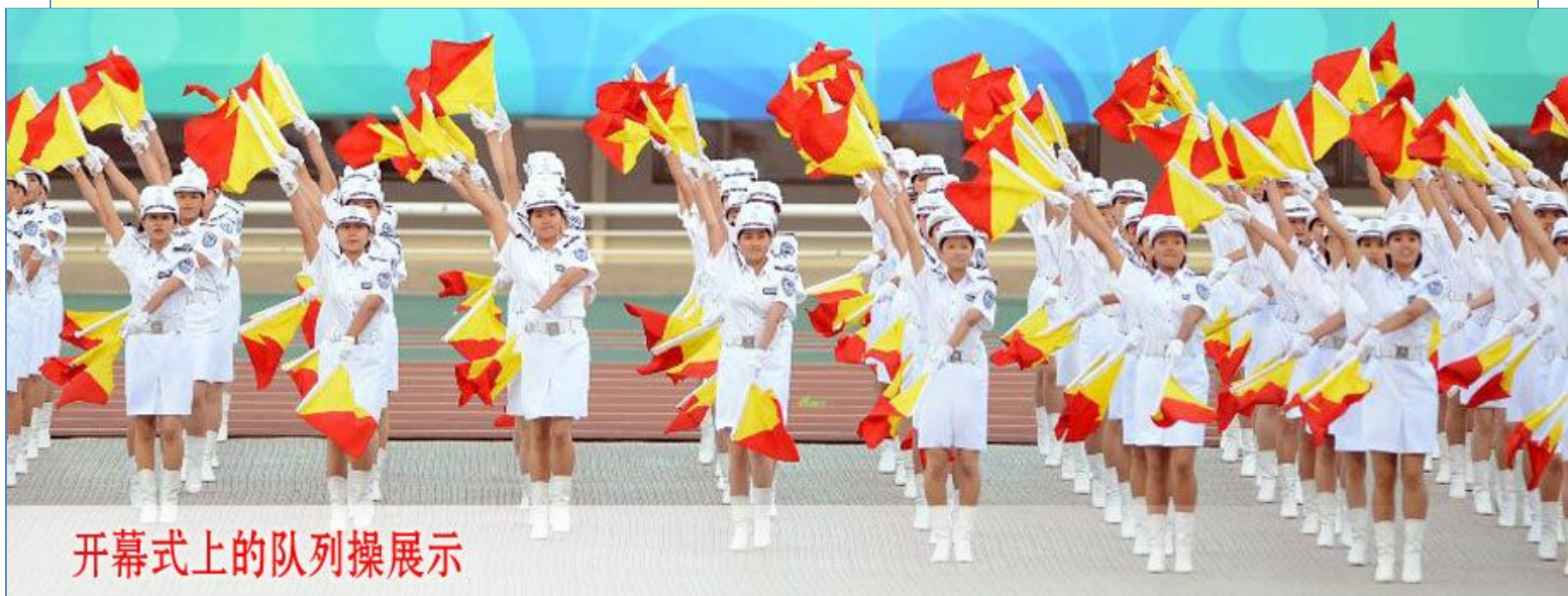
開幕式上的隊列操展示