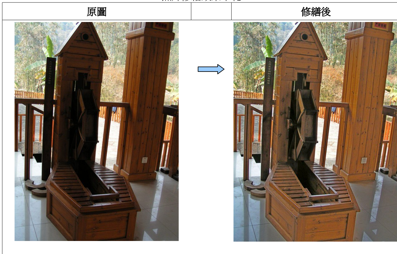
照片修繕效果示範