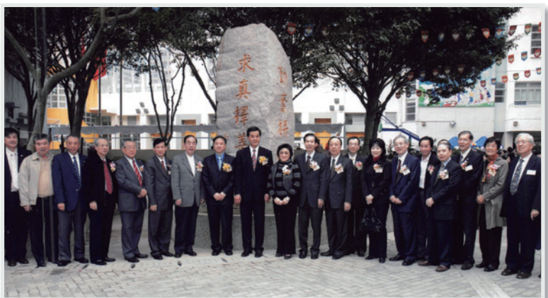
▲ 時任特首的梁振英訪問福建中學留影，右一為鄧統元校長。