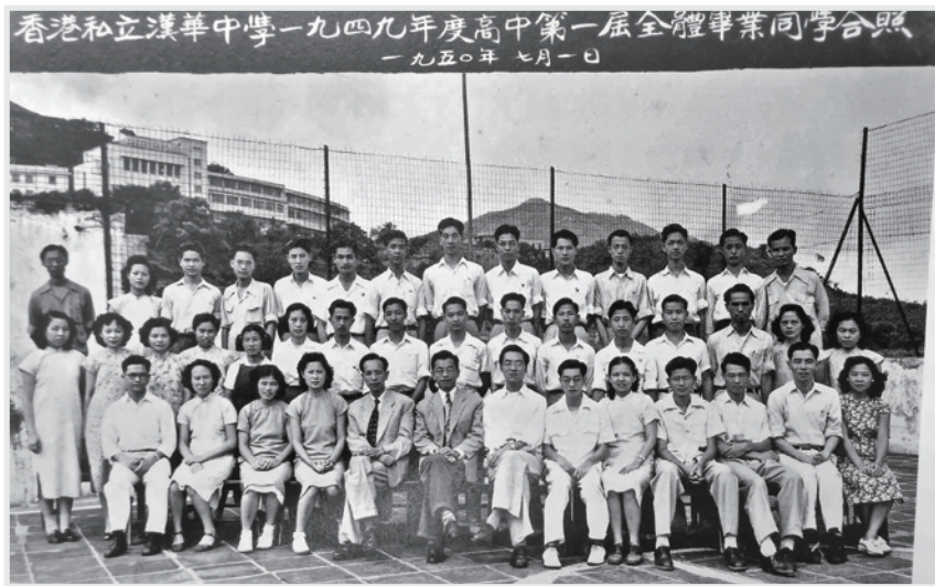
▲ 1949年，鄧校長(前排右七)已開始為香港教育事業出力。