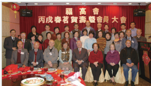
▲ 鄧校長是福建中學高齡教工會創會主席。