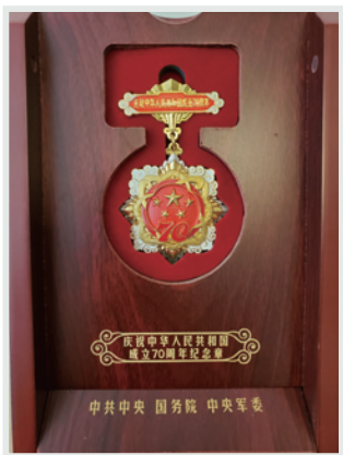
▶ 從中聯辦代表手上接過建國70周年紀念章。