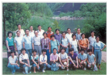
▲ 1987年與同事遊武夷山。