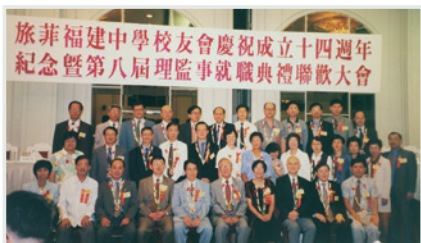
▲ 1999到菲律賓參加理監事就職典禮。